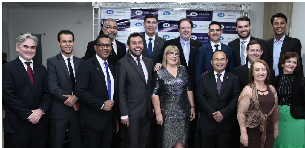
Conselheiros foram homenageados durante a cerimônia